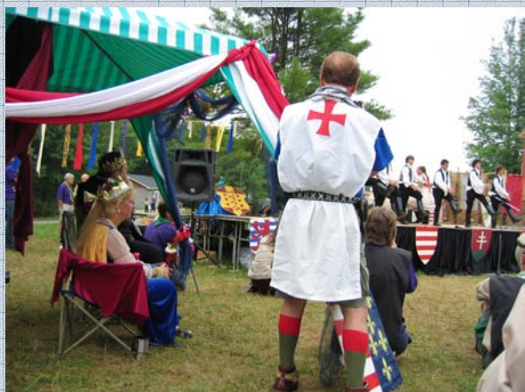
Vári ünnepséa a Királv és Királyné tiszteletére.