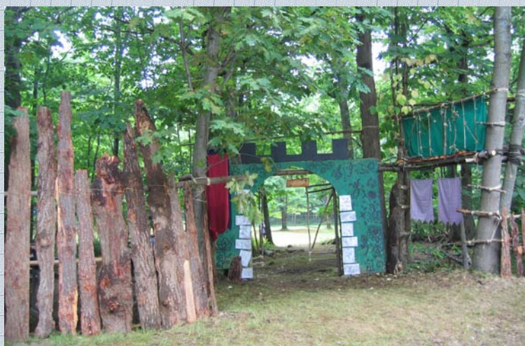
Zemplén Megye, a Tulipán Őrs altáborának bejárata.