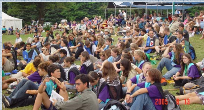
A vár népe részt vesz az ünnepségekben.

Fel, fel Zemplén megye, Fel, fel Zemplén megye, Fel a Hegyaljára! Készen állunk harcra, Zöld köntösünk csillog, Éles kardunk villog. Ki mer szembe állni, Ilyen markos néppel? Lesben áll az apród, Bodrog erdő szélén Lajos Királyunknak!