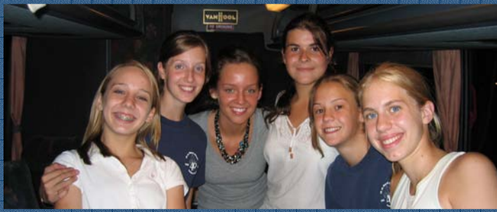
Indulás a Jubi Táborba! (Csillagvirág őr)